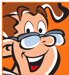
ILLUSTRATION & REKLAM

Spelform Gruppspel där alla möter alla och därefter slutspel för de två främsta i varje grupp. Tidsbegränsade matcher ca 45 minuter fram till 16-delsfinaler.